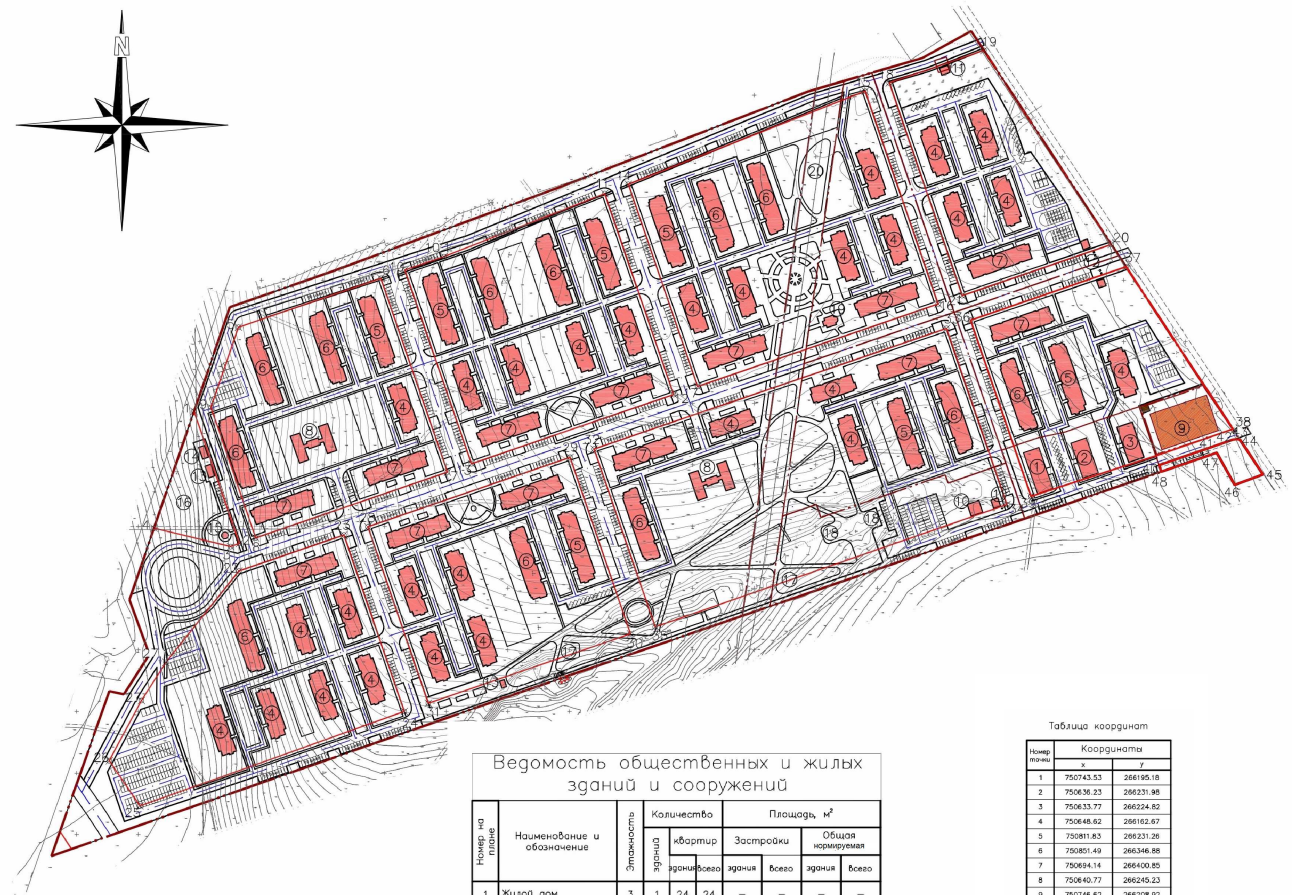
Ведомость общественных и жилых зданий и сооружений